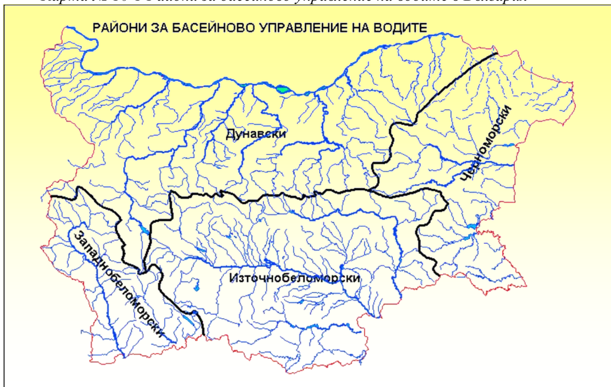
Карта № 10-1 Райони за басейново управление на водите в България

За управление на принципа на речните в басейни в РБългария са определени четири района за речно басейново управление.