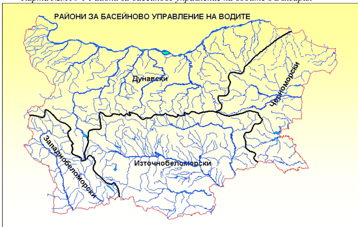
Карта №М10-1 Райони за басейново управление на водите в България

За управление на принципа на речните в басейни в РБългария са определени четири района за речно басейново управление.