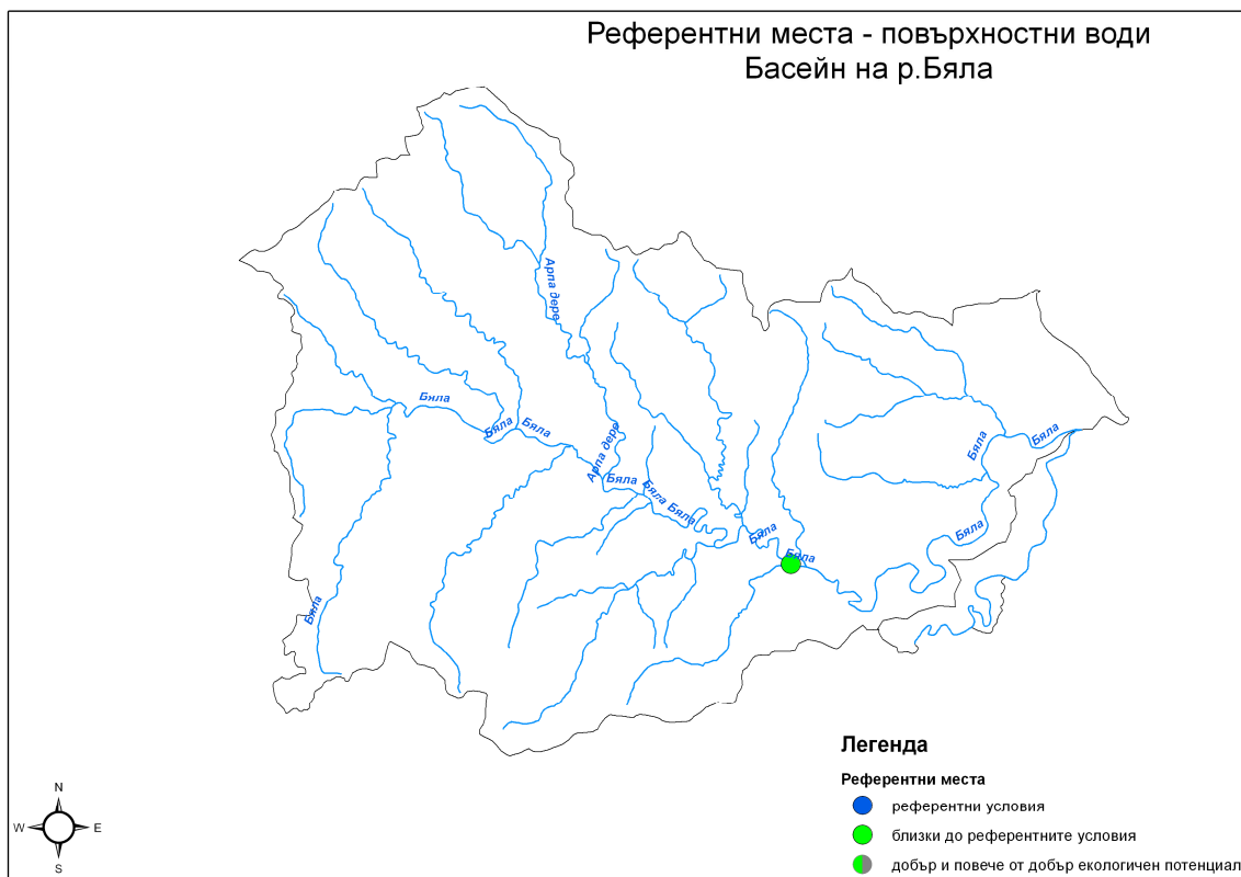
Карта №Б1-5 Места с референтни условия или МЕП в басейна на р. Бяла

Тъй като в басейна на р. Бяла водите са само от категория „реки”, местата с референтни условия или МЕП са определени само за тази категория. В басейна е определено само едно такова място, представено на Карта №Б1-5 и Таблица №Б1-5 .