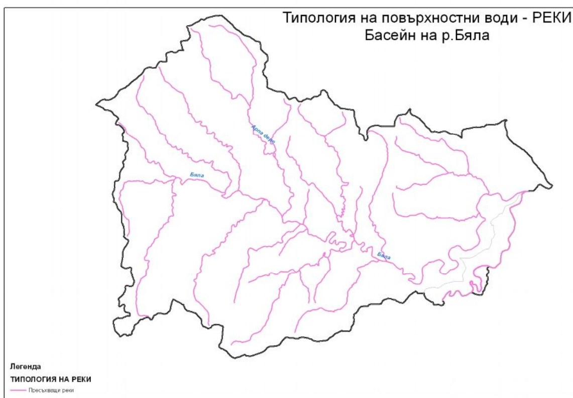
Карта №Б1-4 Типове води категория „реки” в басейна на река Бяла

Повърхностните води в басейна на река Бяла са от един тип, а именно – пресъхващи реки.