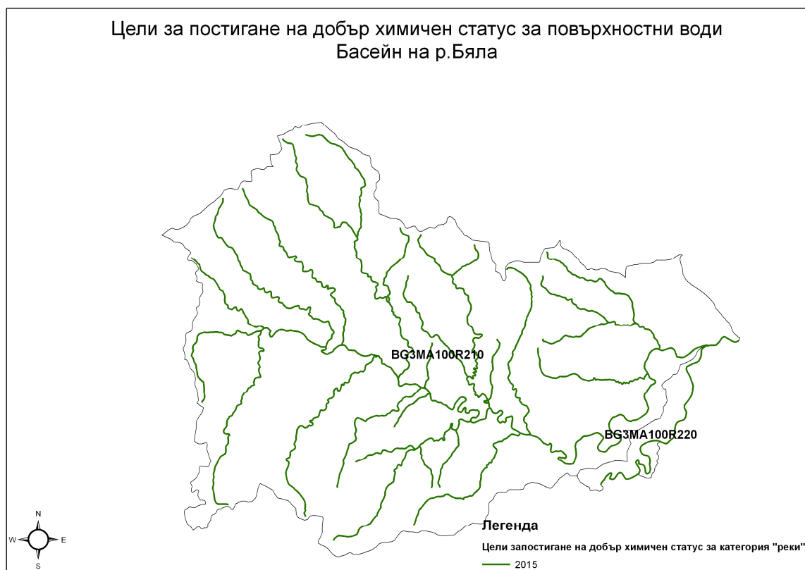
Карта № Б5-1 Срокове за постигане на „доброто химично състояние” на повърхностните ВТ в басейна на р. Бяла

На Карта №Б5-1 са представени целите за химично състояние на повърхностните ВТ в басейна на Бяла.