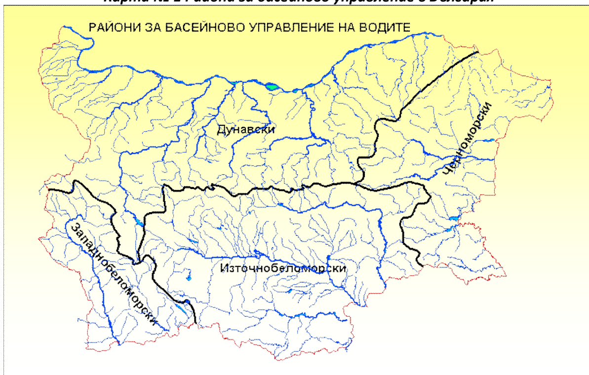
Карта № 1 Райони за басейново управление в България

Границите на районите минават по вододелите на водосборните области на реките в обхвата на държавната граница. В случаите, когато подземните води не следват конкретен речен басейн, те се идентифицират и със заповед на министъра на околната среда и водите се присъединяват към най-близкия и най-подходящия район с басейново управление.