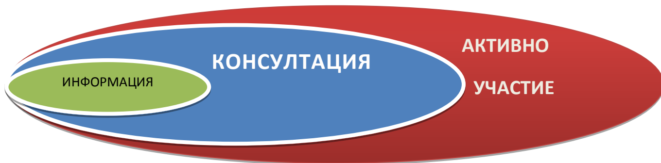
Фигура № 1 Различните нива в процеса на консултация

В процеса на консултиране при всяка една от задължителните три стъпки от разработването на ПУРБ (график и работна програма, междинен преглед на значимите проблеми и проект на ПУРБ съгл. чл. 168 (б) от ЗВ) БДИБР е следвала политиката да информира, консултира и да поощрява активното участие заинтересованите страни и обществеността в процеса на актуализацията на ПУРБ.